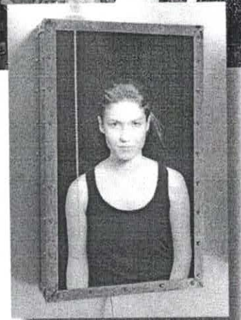
Marck, On / Off, 2 Versionen, 2015 (Ausschnitt), Mixed Media, Video Loop, 20:16 min