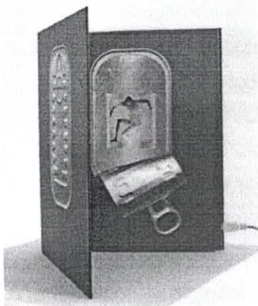
Marck, Splash Sonderedition, Vorzugsausgabe zum Buch, 2016, Booklet, Print, Screen mit Videoloop, 26 x 21 x 1,3 cm, Ed. 90 + 10 AP, verso sign. & num.,

Außerdem gibt es eine Sonderedition des Künstlers, die man in der Galerie erwerben oder bestellen kann. Mehr dazu unter: http://www.galerie-braunbehrens.de/de/editionen/marck-splash.html Kontakt: Galerie von Braunbehrens, Rotebühlstr. 87, 70178 Stuttgart, Fon: 711-528 51 450, www.galerie-braunbehrens.de