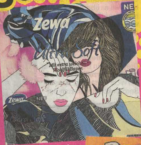
Eine Collage in Verbindung mit einem extraweichen Toilettenpapier